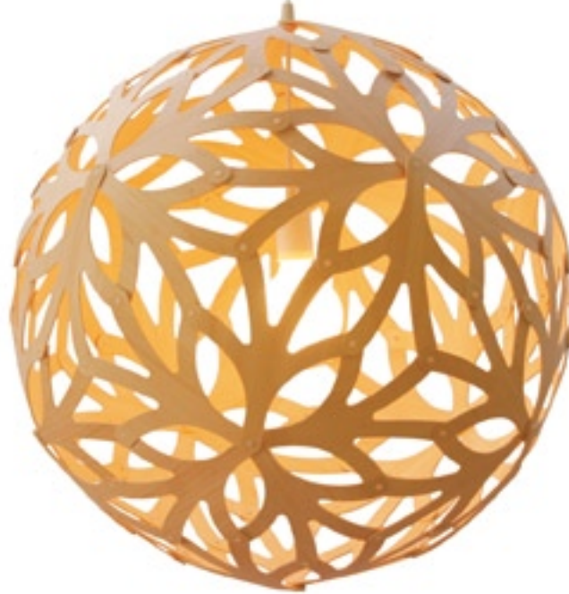
Die Lampe aus Bambus wirft hübsche Schatten an die Wand.

Der Sommer wird kuschelig. Dafür sorgen die Sommerdecken Lina von Steiner 1888 in den Farben Crème, Azur, Jade, Malve, Limette und Ananas. Die Decken aus Merino und Alpaka- wolle gibts ab 215 Franken. Händlerliste unter: www.steiner1888.at