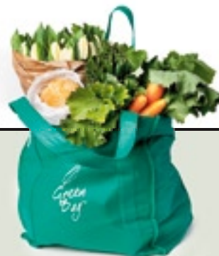
Die Green-Bag besteht ganz aus wiederverwertetem Pet-Material.

Bambus gilt als besonders ökologisch, weil die Pflanze schnell wächst und 30 Prozent mehr Sauerstoff als andere Bäume produziert. Der Lampenschirm wird als Bausatz gekauft, die Montage ist aber keine Hexerei. Die Leuchte gibt es für 590 Franken (60 Zentimeter) oder 790 Franken (80 Zentimeter) in den Changemaker-Shops in Zürich und Bern. www.changemaker.ch